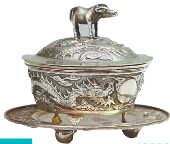
近代上海“时和”号银质龙纹盖碗。