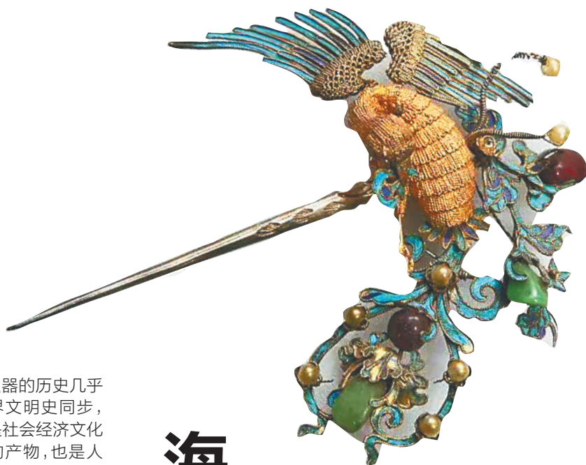
清代金银珠宝飞凤发簪。