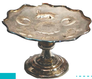
民国银质高脚果盘。

连日来，上海市历史博物馆馆藏银器展览在省博物馆展出，精选上海市历史博物馆馆藏银器及相关文物、文献百余件，受到众多市民游客的关注。海南日报记者带您走进省博物馆，领略古代银器之美、感受海派文化之博、邂逅一段上海的温情岁月。