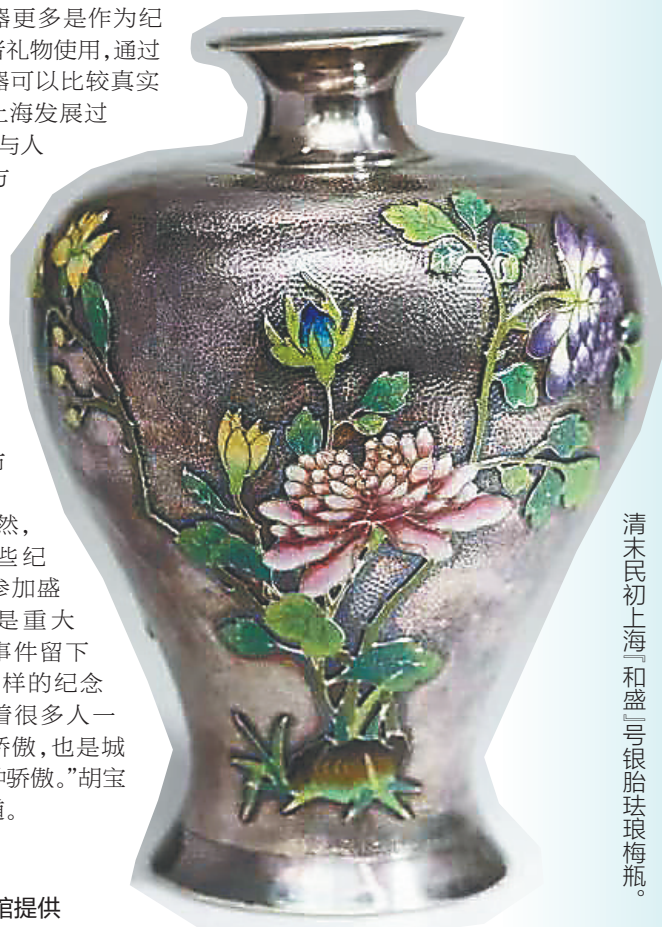
清末民初上海“和盛”号银珐琅梅瓶。

此次展览精选了上海市历史博物馆馆藏银器及相关文物、文献百余件，勾勒出老上海银器及其行业发展轨迹，让市民群众在感受银器美的同时了解一座城市的变迁。