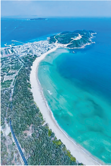
藤海渔村，三面环海得天独厚。

藤海村是一个由疍家渔民组成的小渔村，邻接蜈支洲岛，紧靠皇后湾。独特的地理位置让这里成了年轻人的天下，成了网红打卡渔村。人气的兴旺，促进了商业的繁荣。一条不足百米长、八米宽的小街上，簇拥着各式商家。凸凹不平的青石板小路通向村里。小街不能通车，只能步行。小巷间、石阶旁、民宿院落前、休闲区里，众多游客、驴友、冲浪发烧友在此谈天说地。不用考虑语言，一瓶啤酒、一声招呼、一个微笑或是一场游戏比赛，没几分钟，便成了朋友。