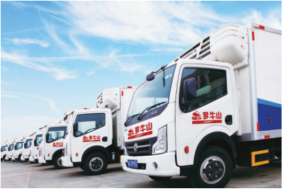
罗牛山冷链物流运输车队