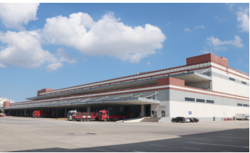
罗牛山冷链物流园5号库

罗牛山冷链物流园位于海南省海口江东新区，园区占地面积325亩，总仓储容量30万吨，其中常温库20万吨，冷库10万吨，是海南省知名的现代化食品综合物流园区，致力于打造海南自贸港冷链物流全类食品一站式综合服务平台。