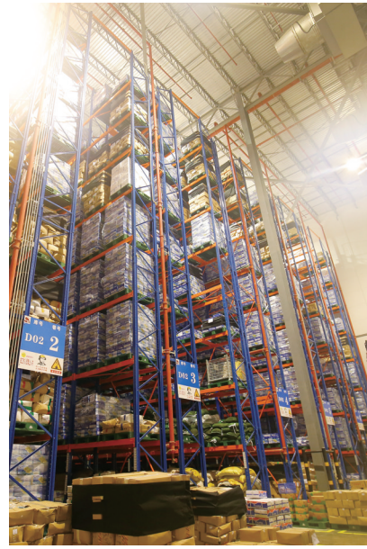
罗牛山冷链物流园-18℃高位冷库

罗牛山冷链物流园位于海南省海口江东新区，园区占地面积325亩，总仓储容量30万吨，其中常温库20万吨，冷库10万吨，是海南省知名的现代化食品综合物流园区，致力于打造海南自贸港冷链物流全类食品一站式综合服务平台。