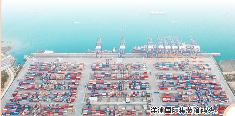
洋浦国际集装箱码头。

当前，海南货物贸易、服务贸易、实际使用外资、实际对外投资等指标全线飘红，实现快速增长，外向型经济蓬勃发展、活力凸显。海南继2021年货物进出口首次突破1000亿元后，2022年再上新台阶，首次突破2000亿元，达到2009.5亿元，增长36.8%。服务贸易增长21.6%。实际使用外资超40亿美元，增长15%。实际对外投资18.95亿美元，同比翻倍。2022年在海南投资的国家地区共127个，欧美外资市场主体数量和实际到资大幅提升。