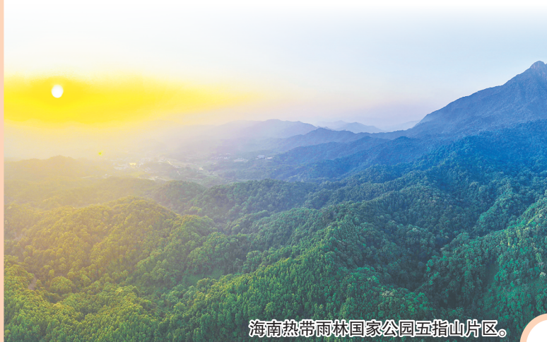
海南热带雨林国家公园五指山片区。

海南举全省之力，高质量推进海南热带雨林国家公园建设，打造中国国家公园海南样本，从坚持体制机制创新到坚持规划引领，从坚持整体保护、系统修复、综合治理，到坚持生态保护、绿色发展、民生改善相统一，热带雨林国家公园建设的每一步都稳扎稳打。2021年，海南热带雨林国家公园跻身首批5个国家公园行列。2022年，海南热带雨林国家公园成为首个完成自然资源确权登簿的国家公园。