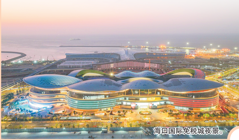
海口国际免税城夜景。

海南以国际旅游消费中心建设激活消费引擎，高端购物、医疗、教育三大境外消费回流逐渐成为自贸港“金字招牌”，离岛免税销售额五年超1300亿元，博鳌乐城引进国际创新药械290种、成为国际创新药械进入我国的快速通道，陵水黎安获批6所中外合作办学机构（项目）并正式招生开学。2022年，海南发放价值5300万元的旅游消费券，截至2022年12月31日活动结束，核销率达到95.3%，市场带动比2.33，有力促进了旅游产业加速回暖。