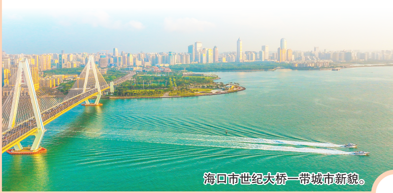
海口市世纪大桥一带城市新貌。

海南坚定不移加快建设海南自由贸易港，在服务构建新发展格局的战略大局中引领对外开放，奋力把海南自贸港打造成为双循环上重要的交汇点，彰显中国“开放的大门只会越开越大”的决心。随着当前封关运作准备工作全面启动，海南牵头负责的25个封关运作项目全部开工建设。“三张清单”有序实施。15%所得税个人和企业享惠面分别增长122.7%、35.7%，跨关区保税油直供、市场准入特别措施、外汇管理简化等政策接续落地或完成首单。自用生产设备“零关税”等政策滚动升级。“一线放开、二线管住”试点扩区顺利实施，AEO认证企业数量翻番。