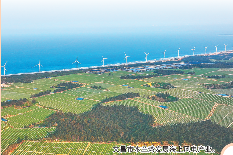
文昌市木兰湾发展海上风电产业。