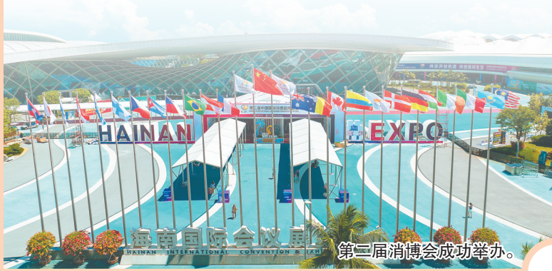
第三届消博会成功举办。

消博会作为全球消费精品展示交易平台，叠加海南自贸港和RCEP政策优势，将促进全球经贸交流合作，与全球共享中国市场机遇。2021年5月6日至10日，首届消博会在海口举办。至今，消博会已连续两届成功举办，其溢出效应让海南的“朋友圈”不断扩大，展品变商品，展商变投资商。第三届消博会将于今年4月11日至15日在海口市举办，4月10日举行开幕式等活动。本届消博会展览总面积共10万平方米，其中，国际展区8万平方米，国内展区2万平方米，将成为2023年四大展会中首场线下举办的展会。