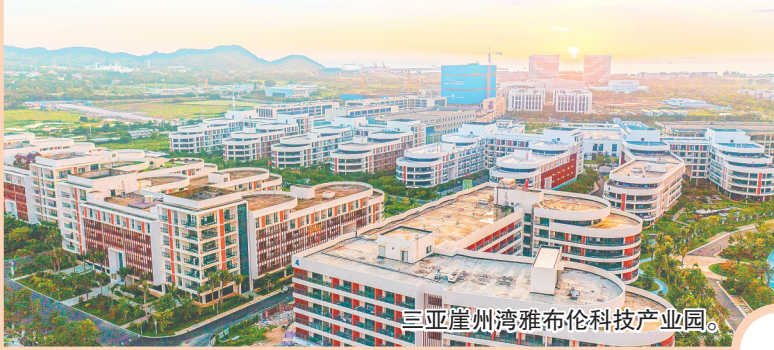
三亚崖州湾雅布伦科技产业园。

推动海南省崖州湾种子实验室快速发展，崖州湾实验室挂牌运行，国家耐盐碱水稻技术创新中心实质性运行；省部共建“南海海洋资源利用国家重点实验室”获批，实现我省大学国家重点实验室零的突破；海南省深海技术创新中心围绕“小核心、大网络”深海科技协同创新体系，与国内各行业优势力量组建系列联合实验室，形成了具有海南特色的海岛辐射模式；首个全国商业发射场开工建设，海南省航天技术创新中心挂牌成立，将组织开展科技研发、成果转化和产业化，加快构建落地海南的火箭、卫星、数据三大领域创新链、产业链、人才链，打造空间科技创新战略高地。