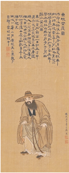
《东坡笠展图》。本版图片除署名外均为资料图