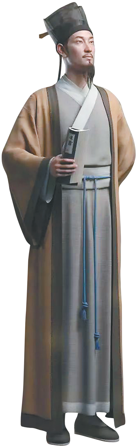
央视发布的“数字人”苏东坡。