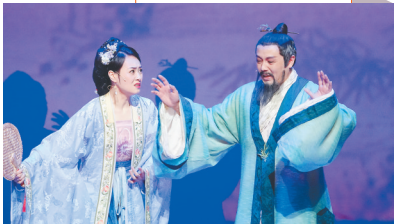
话剧《苏东坡》中的东坡(右)。

央视播出的“2023中国诗词大会”第五场，“数字人”苏东坡闪亮登场，以“历史情景再现”的形式为选手出题，并与主持人、嘉宾互动，赢得观众喝彩。东坡作为千年“网红”，备受人们喜爱。事实上，自宋以来，历代画师、文人乐此不疲为东坡画像、刻像。当代也有不少影视剧通过具象化的手段来演绎东坡的生平事迹。那么历史上的东坡究竟长什么样？让我们借助相关画作和诗文一起来探一探。