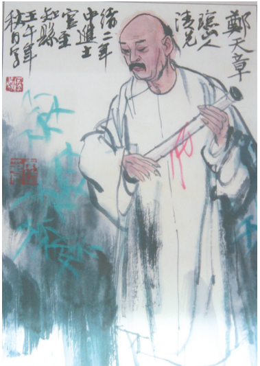
琼台师范学院海口校区(琼台书院)校史展览室里的郑天章画像。

目前，宋代渡琼的郑钦后人，除了落籍地那林(新民村)，还分布在海口西部的文章、文新、荣山、镇海、博养等村落，以及澄迈、临高、琼中等市县，人口约有2万。