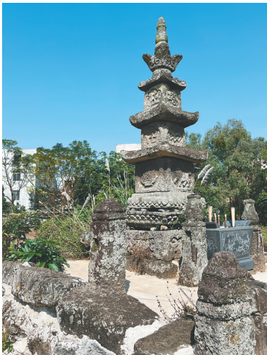
新民村的省级文保单位“常住宝塔”。