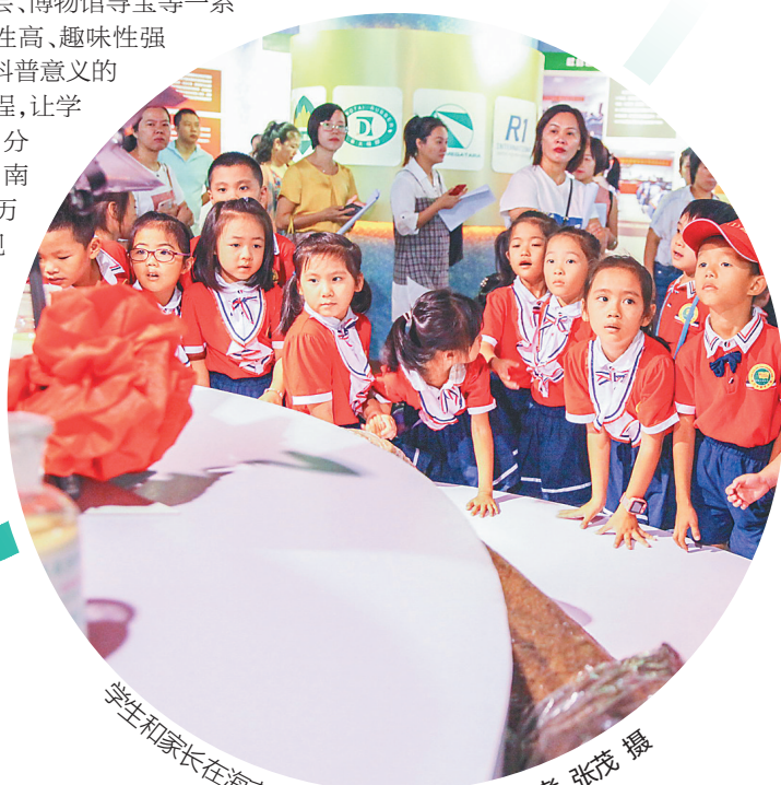
学生和家長在海南农垦博物馆参观。