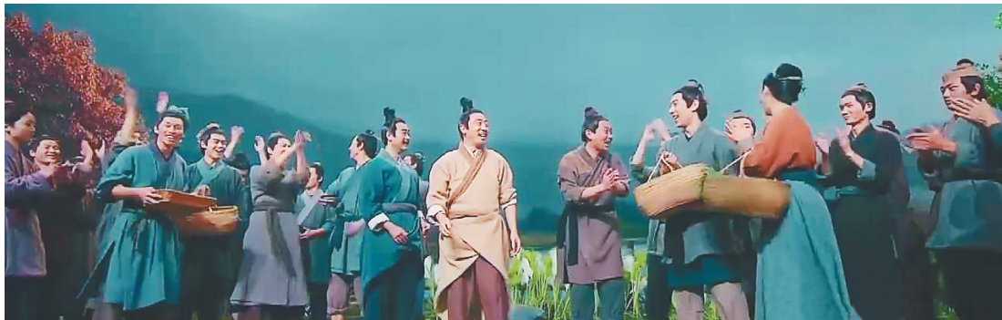
《典籍里的中国》第二季第六期《齐民要术》剧照。