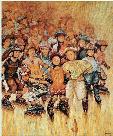
《轮滑宝贝》(油画) 丁孟芳