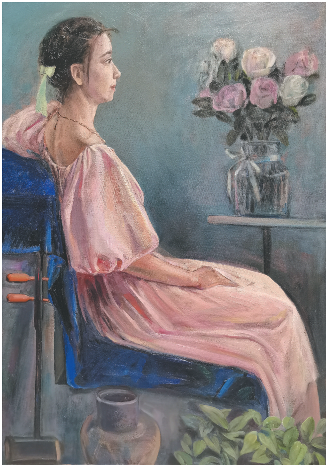
《女孩与花》(油画) 桂小径

3月7日上午,为展现当代海口女艺术家的巾帼风采,促进海口文艺事业的发展,由海口市妇女联合会、海口市文学艺术界联合会主办的“喜庆国际妇女节·巾帼绽放自贸港——海口女艺术家优秀作品展”(以下简称“海口女艺术家优秀作品展”)在省书画院开展。 展览共展出海口135位艺术家的优秀作品150件,展品涵盖国画、油画、版画、雕塑、水彩、综合材料、剪纸、沙画等美术作品90件、书法作品30件、摄影作品30件。这是海口美术史上较为独特的一场艺术展。