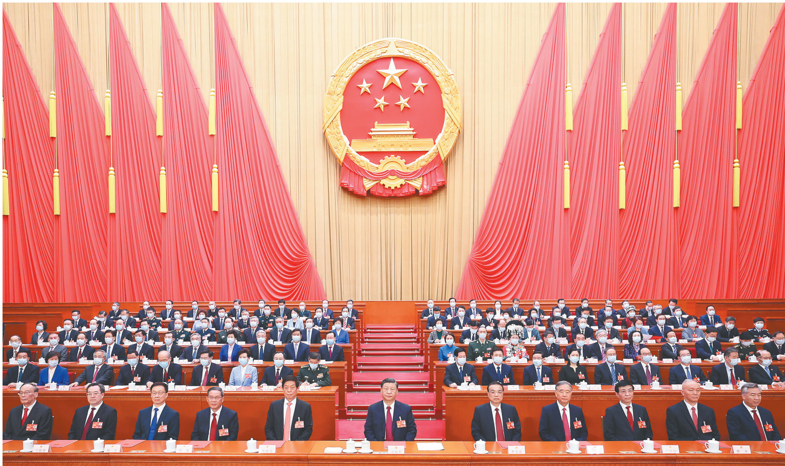
3月13日,十四届全国人民代表大会第一次会议在北京人民大会堂闭幕。习近平等党和国家领导人在主席台就座。

新华社北京3月13日电 中华人民共和国第十四届全国人民代表大会第一次会议,在圆满完成各项议程,产生新一届国家机构组成人员后,13日上午在北京人民大会堂闭幕。