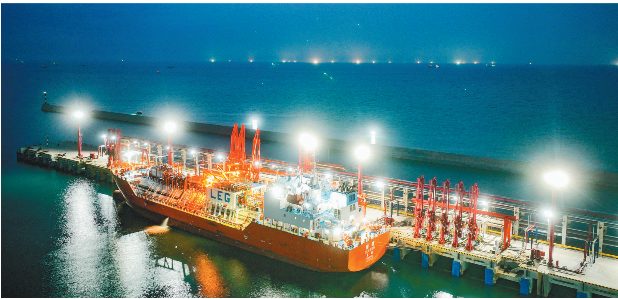
海南炼化乙烯码头：装船作业忙

列配套活动。 目前，消博会时装周正联动海口国际免税城、华润万象城、百方购物中心、世纪海角等1500余家高端消费场景与热门旅游景点开启“热岛计划”，打造全岛消费娱乐购物节。消费者可凭借打卡徽章或时装周门票在指定商家享受优惠折扣及限定福利。