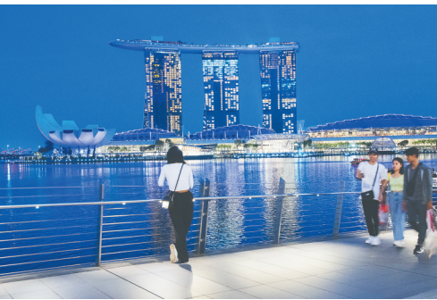
这是在新加坡拍摄的亮起蓝色灯光的建筑。新加坡的多处建筑于3月22日亮起蓝色灯光,以纪念世界水日。 新华社发