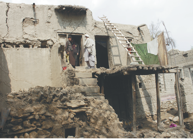
3月22日,当地居民在阿富汗拉格曼省查看在地震中受损的房屋。