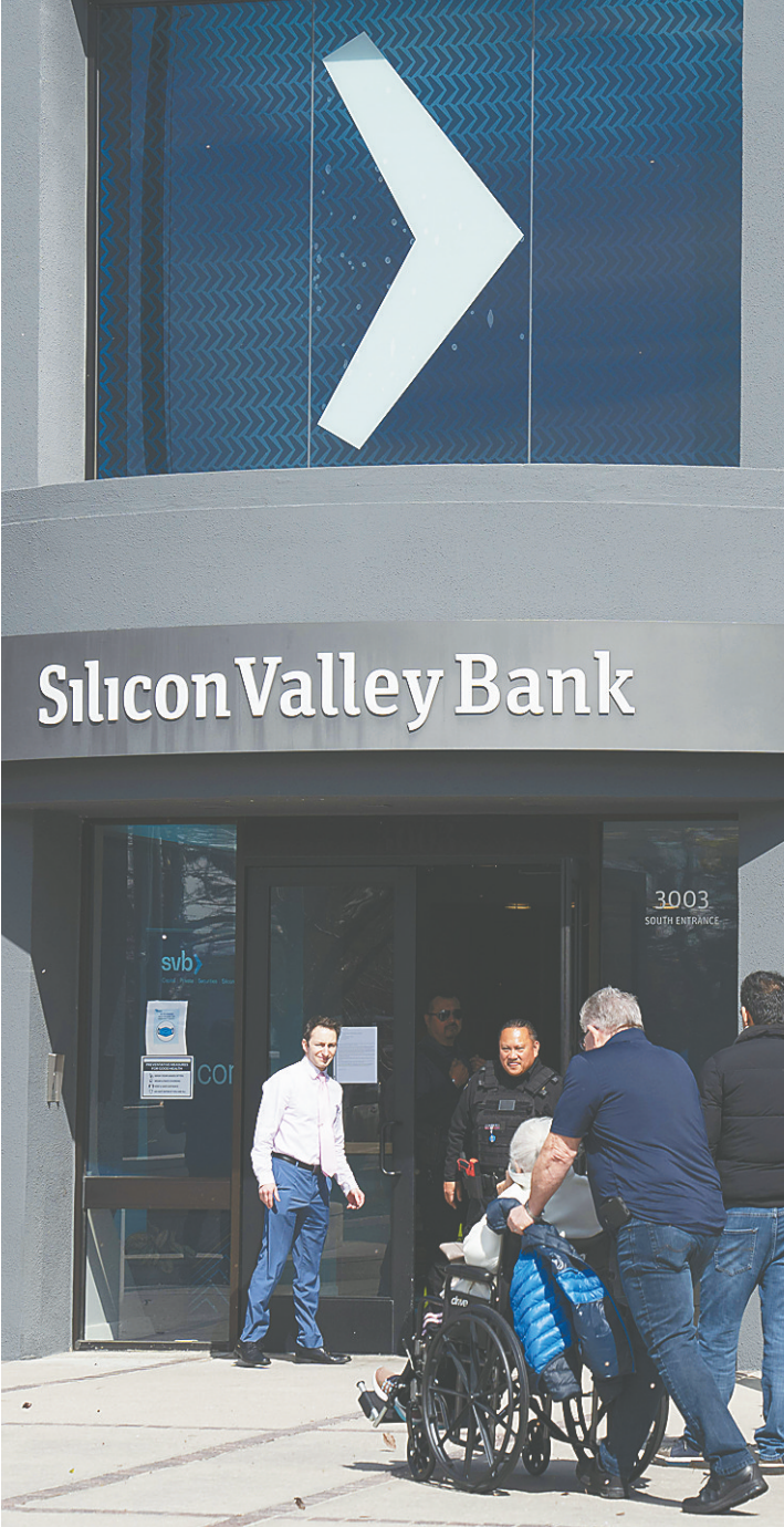
日前,客户在美国加州硅谷银行总部外排队等候办理业务。

日前倒闭的美国硅谷银行相关资产清算正在进行中,美国媒体21日援引政府数据报道,硅谷银行去年第四季度向“内部人士”大举放贷2.19亿美元,规模为二十年之最,或有违规之嫌。 受硅谷银行拖累,它原来的母公司硅谷银行金融集团17日申请破产保护。该集团试图在申请破产前一天提取它在硅谷银行的20亿美元存款,发现已被冻结。该集团代理律师21日称,负责硅谷银行清算管理的联邦储蓄保险公司阻止它提现的行为“不当”。