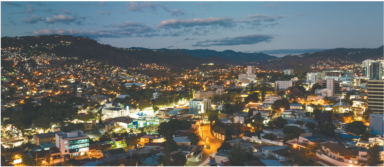
洪都拉斯首都特古西加尔巴。

府，台湾是中国领土不可分割的一部分。洪都拉斯自即日起断绝与台湾的所谓“外交关系”并停止与台湾的一切接触和官方关系。