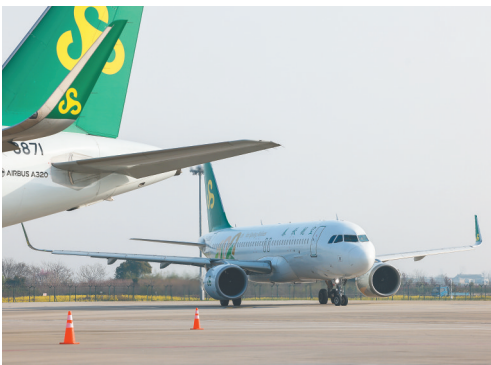
3月26日，飞机在江苏扬州泰州国际机场准备出港。