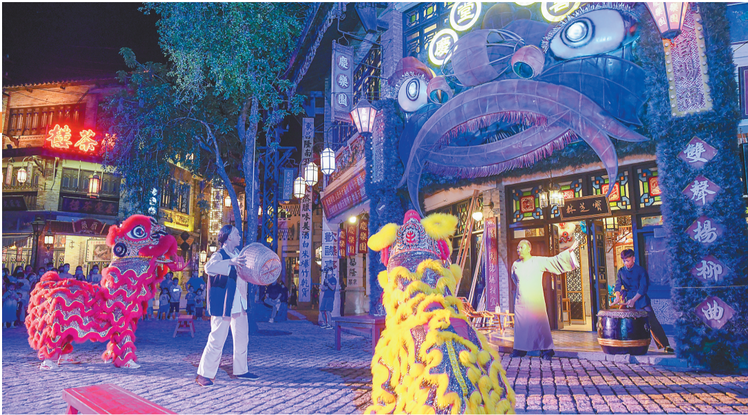
去年十月二日,户外实景演艺《南洋往事》前奏版在海口公演。