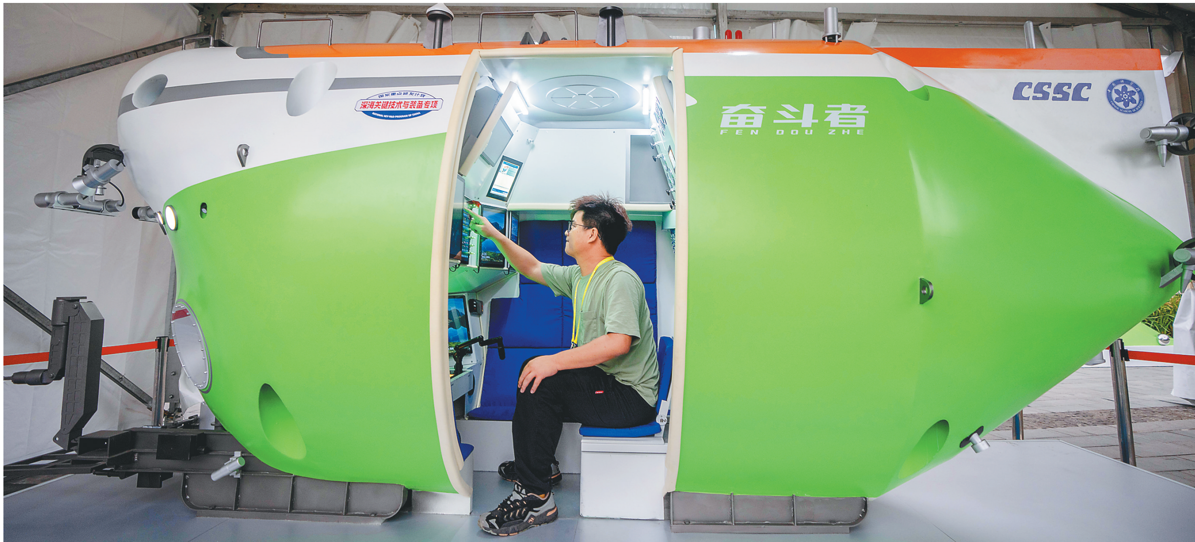
3月27日，在即将开幕的三亚创新发展主题展现场，“奋斗者”号模型吸引媒体记者体验。

三亚崖州湾科技城位于海南三亚西部，重点打造以深海科技、南繁种业为主导，生命科学、数字经济等产业协同发展的高新技术开发区，是海南自贸港重点园区之一。