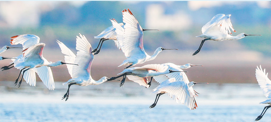
飞翔中的黑脸琵鹭。