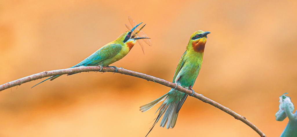
在海口五源河国家湿地公园,栗喉蜂虎正在进食。