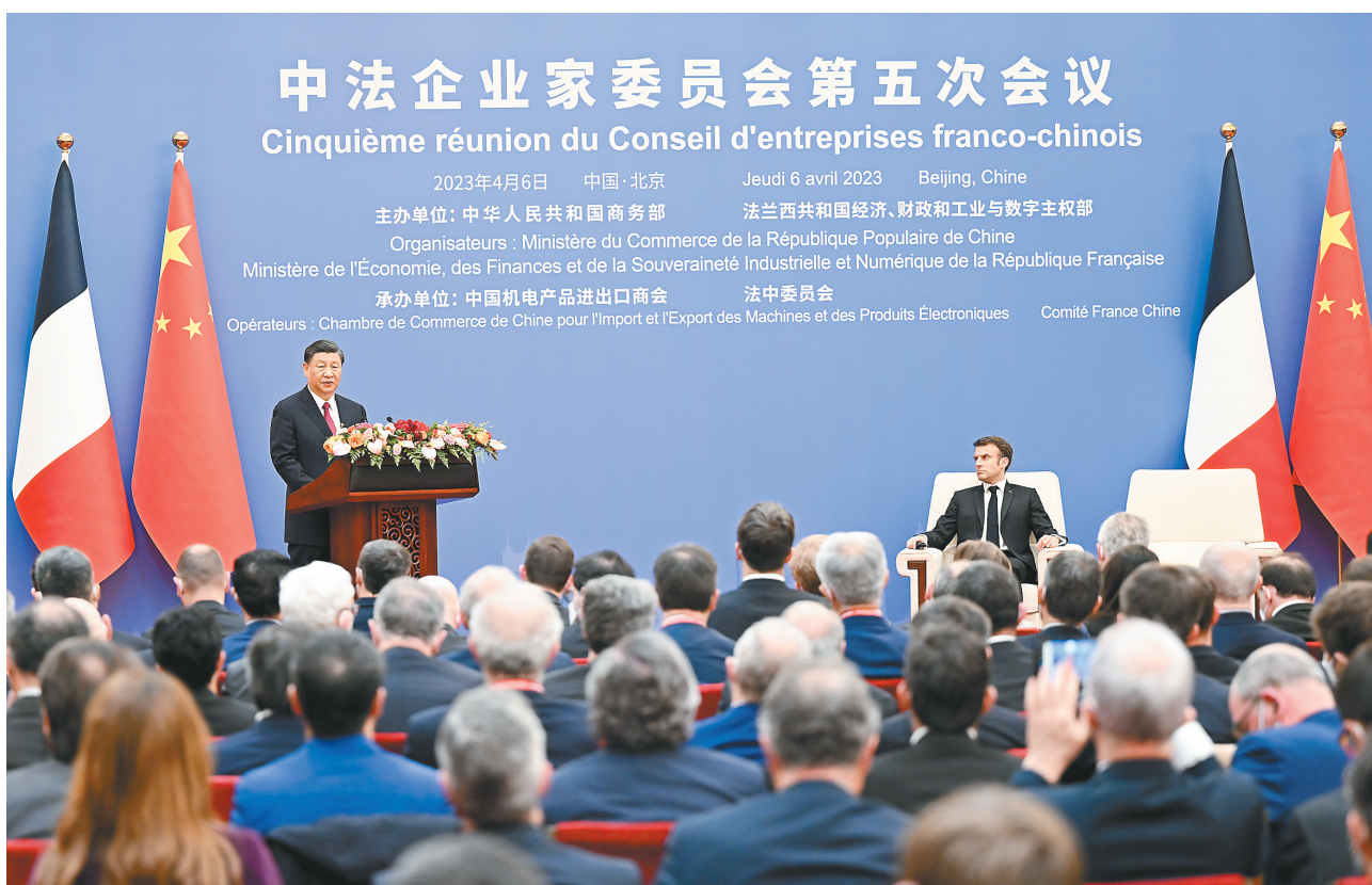
4月6日下午，国家主席习近平在北京同法国总统马克龙共同出席中法企业家委员会第五次会议闭幕式并致辞。