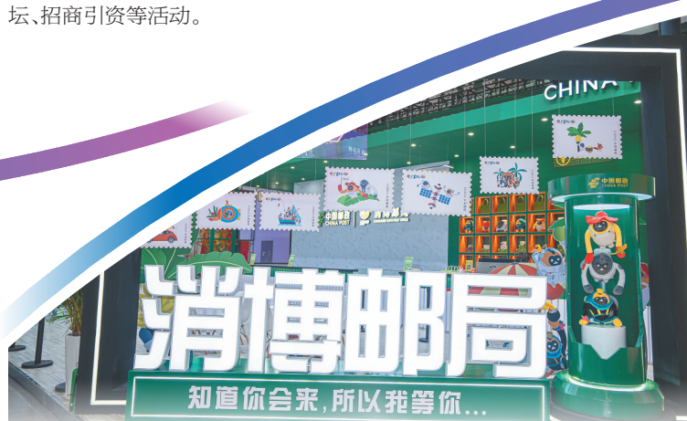
第二届中国国际消费品博览会上的中国邮政展台