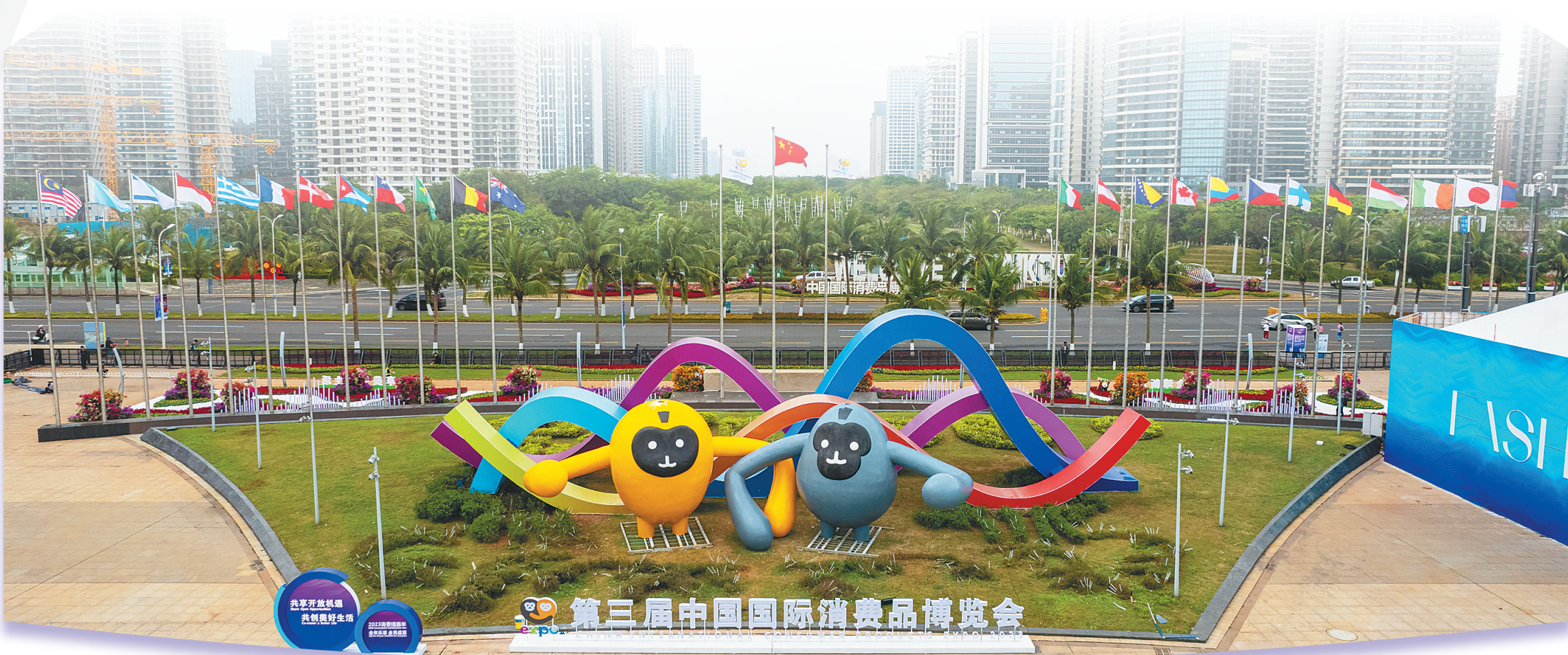
四月八日，第三届中国国际消费品博览会海口国家会展中心中心装饰一新。

4月10日，第三届中国国际消费品博览会（以下简称消博会）将在海口拉开大幕，奇珍异宝琳琅满目、特色展馆看点十足、国潮新品精彩上新、智能产品惊艳亮相，全球精品、全球机遇汇聚海南。来自60多个国家和地区的超3300个消费精品品牌参展，采购商和专业观众预计超5万人……宾朋云集、万商会聚，展会期间还将举办百余场论坛研讨、成果发布、贸易洽谈、投资推介等活动，南海之滨再次谱写开放融通、互利共赢的恢宏乐章。