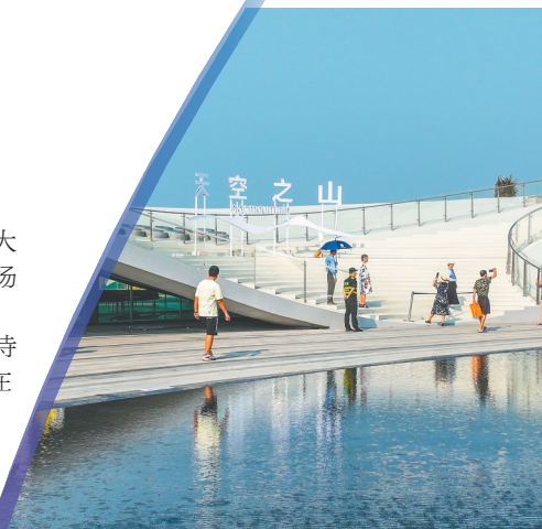
海口“天空之山”驿站。（资料图）