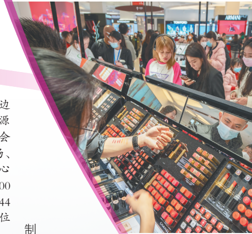
免税商品受青睐。（资料图）