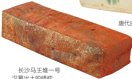
长沙马王堆一号汉墓出土的绣枕。