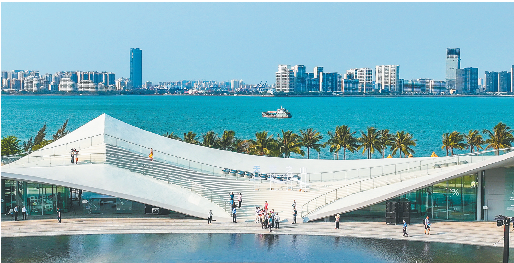
海口“天空之山”驿站吸引众多市民游客前来“打卡”。

当前,海南自贸港建设的热度正不断升温。作为省会城市的一部分,海口市美兰区在享受自贸港建设政策红利的同时,不断增强自身发展动力,全力培育新的经济增长点。 在“绿水青山就是金山银山”理念的加持下,美兰区不断深挖资源禀赋,从自然资源、人文历史等多方面着手,打造一个又一个新的旅游增长点,催热全域旅游建设,带动新的发展热潮。