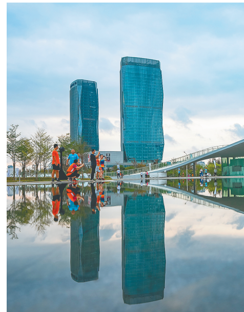
华彩海口湾广场。

海口市美兰区商务局有关负责人介绍,该区通过对望海国际广场、华彩海口湾广场、秒秒湾文化商业街经营商户发放消费券的方式,有效激发市民游客消费热情,带动辖区经济高质量发展。