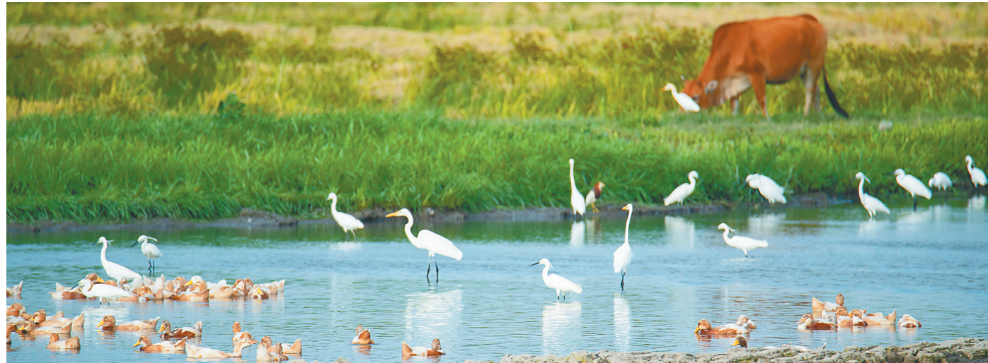
潭门镇福田村农民在湿地里放养的鸭子与白鹭一起觅食。

建筑垃圾堆场的“变身”，不止看到的那么简单。琼海市城投公司相关负责人表示，循环花园地下还埋着雨水调蓄池，降水被收集起来，可循环使用。此外，花园内还布设太阳能庭院灯和科普标识，就连花园内植物也都是选择乡