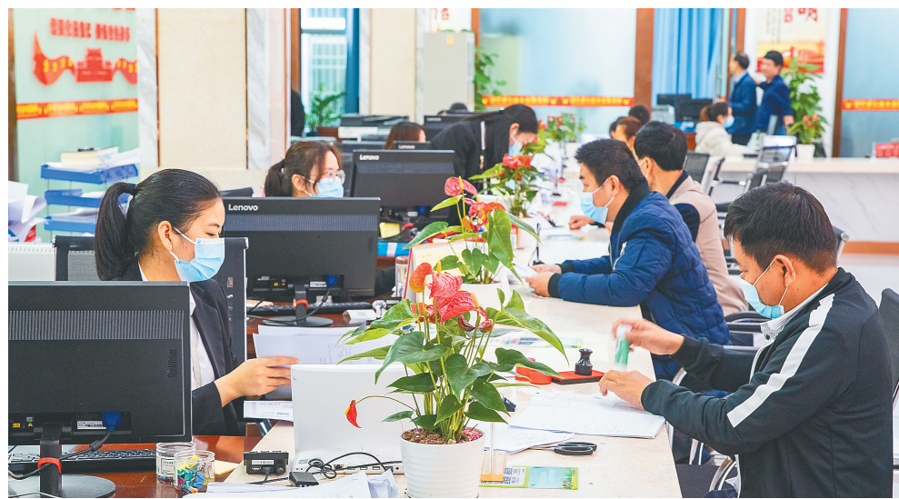
在万宁市政务服务大厅,工作人员为企业代表办理业务。