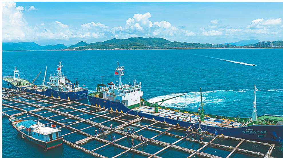
在万宁市海域,工人往日籍渔船上搬运鲷鱼苗。