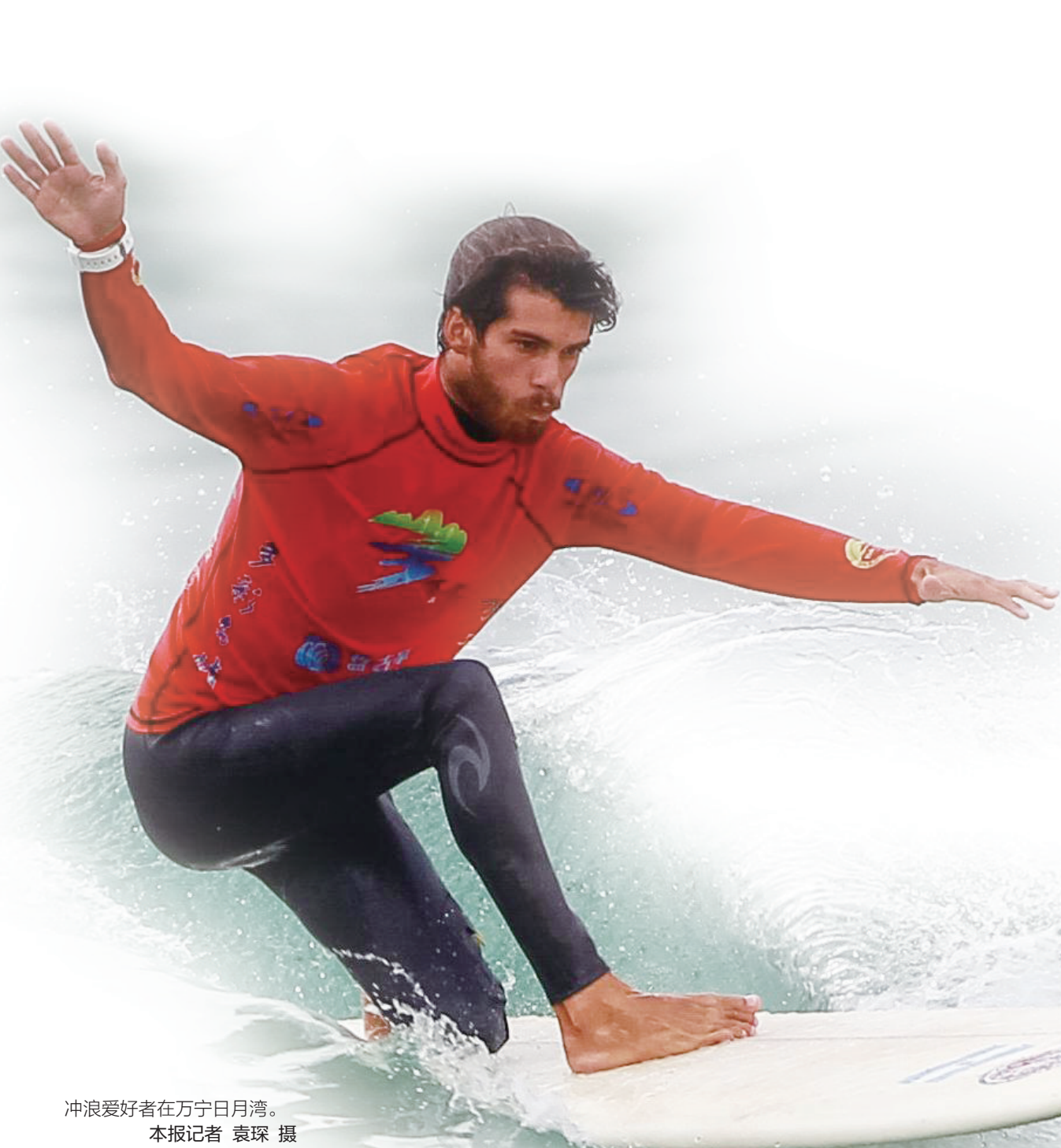
冲浪爱好者在万宁日月湾。

4月的万宁,春意盎然,阵阵暖风从海上吹过,卷起层层叠叠的浪花,浸润着这片绿色充满生机活力的土地——