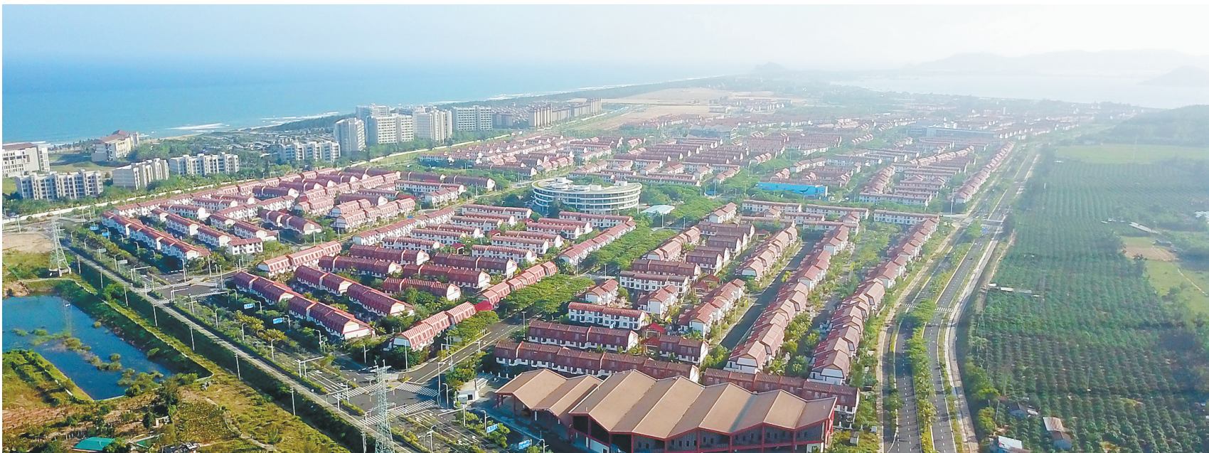
黎安(海风小镇)片区。