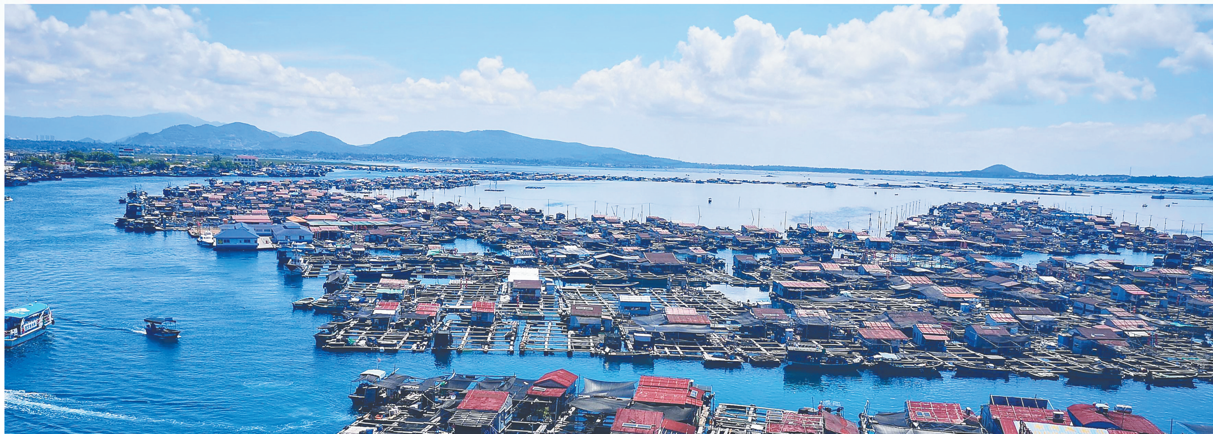
新村疍家文化旅游区。