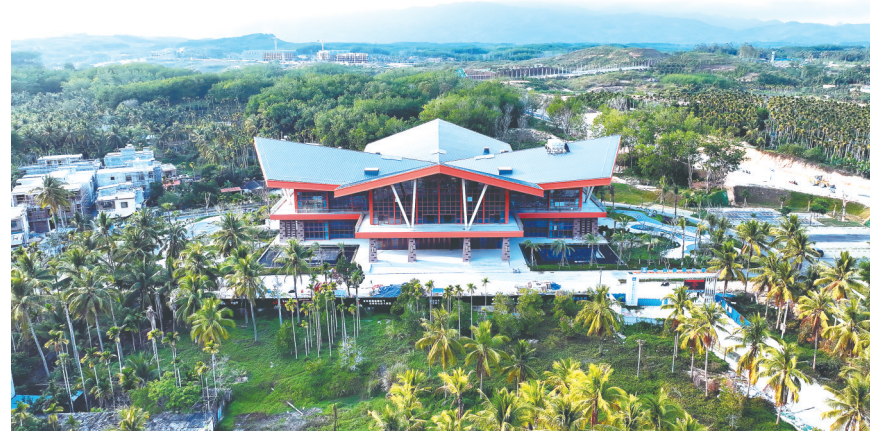
南平健康养生产业园区。