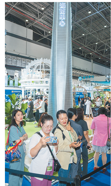
4月11日,在第三届消博会海南控股馆,两位排队的女士在自拍。