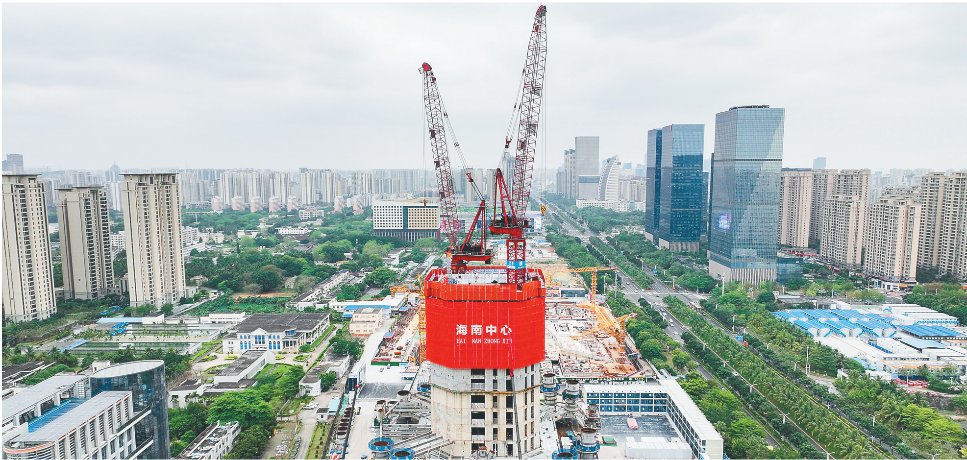
四月十三日,海南中心项目安装完成轻量化顶模集成平台,“空中造楼机”亮相海南。