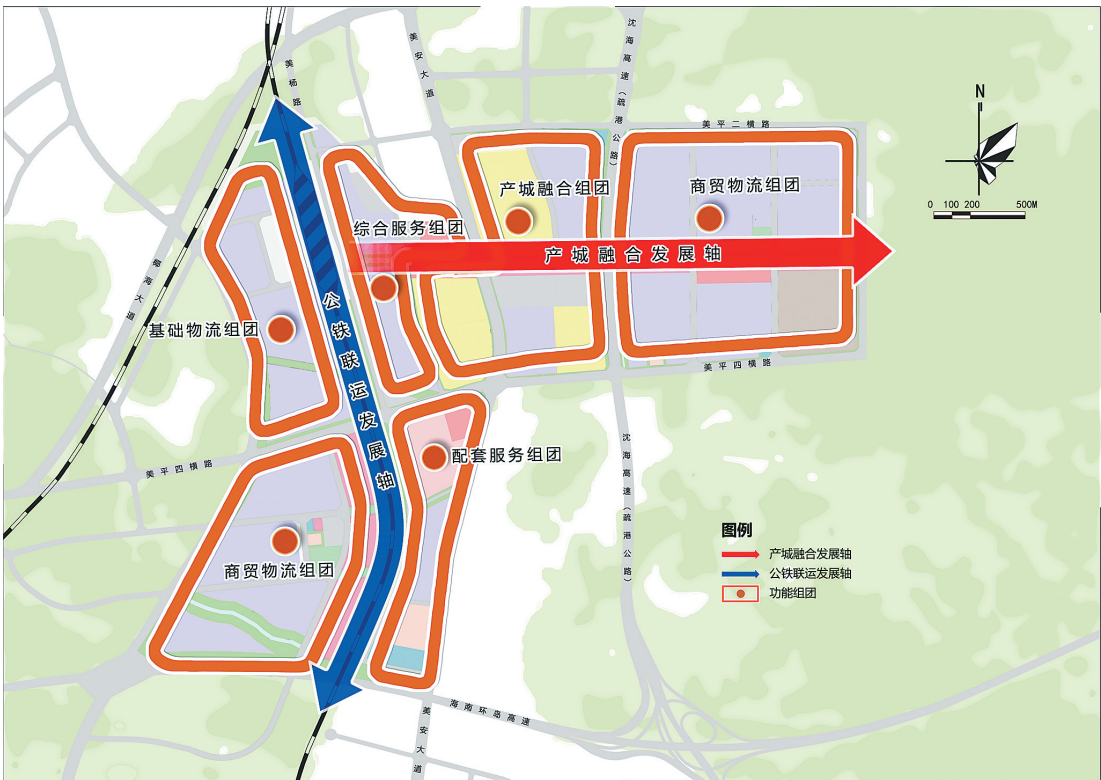
物流园区规划结构图。