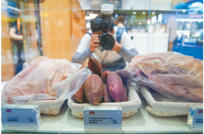
4月11日，澄迈在本届消博会上展示了桥头地瓜、白莲鹅等特色农产品。