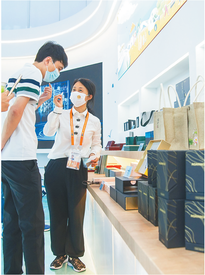
4月10日，在本届消博会海南馆，嘉宾体验澄迈的沉香产品。