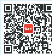
↑扫码看H5 ↓《画说吾琼》H5封面图

本报讯(海报集团全媒体中心记者 林芷羽)4月13日,新海南客户端、南海网、南国都市报推出《画说吾琼》一场向世界开放的海南画展H5,用画展形式展示五年来海南自贸港建设蹄疾步稳、蓬勃兴起,向着更加开放、更具活力的新征程阔步前行的景象。该H5呈现多位画家记录海南自贸港蓬勃发展的一幅幅画作,展示海南自贸港“绿”出生机、“拼”得火热、“变”出新貌、“热”遍全球、“通”往新途的崭新气象。