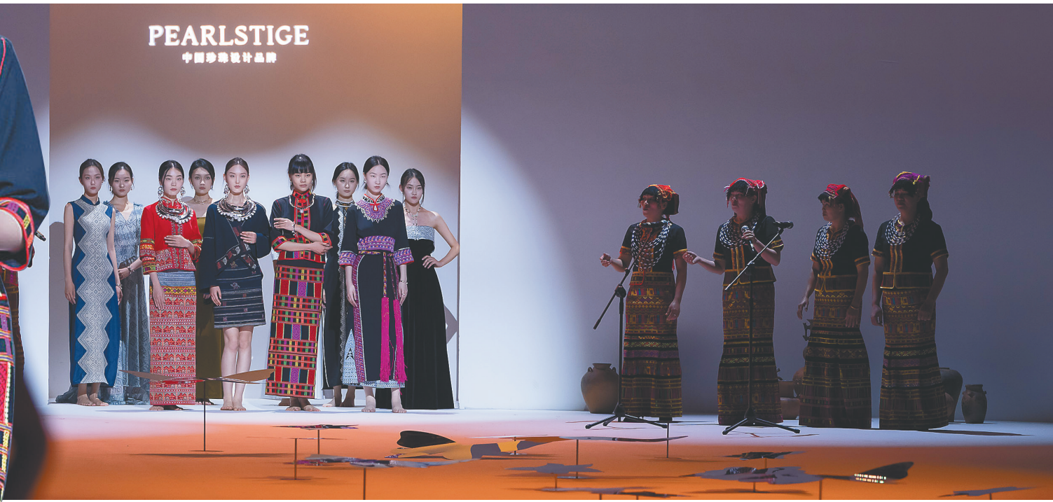
4月15日，第三届消博会时装周闭幕仪式暨昌江“向往昌江，邂逅微光”闭幕秀活动在消博会主秀场举行。

当黎锦、黎陶、黎歌、黎乡风光、牛皮凳等元素遇上时装周，会发生什么样的“化学反应”？4月15日上午，第三届消博会昌江“向往昌江，邂逅微光”主题活动暨消博会时装周闭幕秀在海南国际会展中心落下帷幕，谜底就此揭开——传统文化与现代工艺碰撞，带来了一场视觉、听觉盛宴。