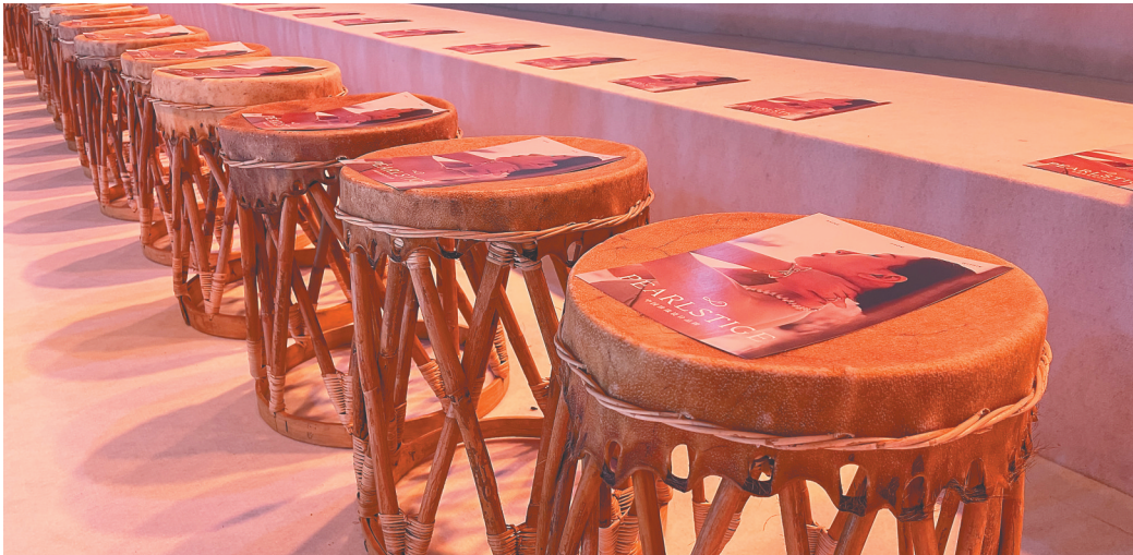
4月15日，在“向往昌江，邂逅微光”闭幕秀活动上，主办方在观众座席处摆放采用黎族传统手工艺制作的牛皮凳。