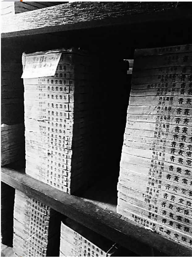
保存在海南师范大学樟木书柜中的古籍。资料图