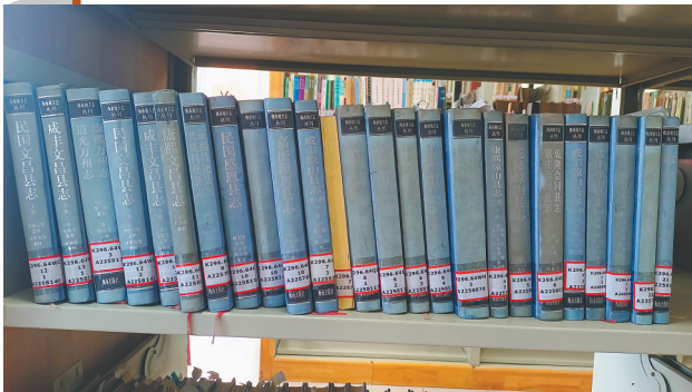
《海南地方志丛刊》。

2004年，时任海南大学图书馆馆长詹长智等学者与广东省中山图书馆合作，着手补充收集广东、海南两地的资料，最终于2008年出版了《海南地方文献书目提要》。该书收录了目前存世的海南地方文献书目5150种，成为研究海南历史文化的重要工具书。