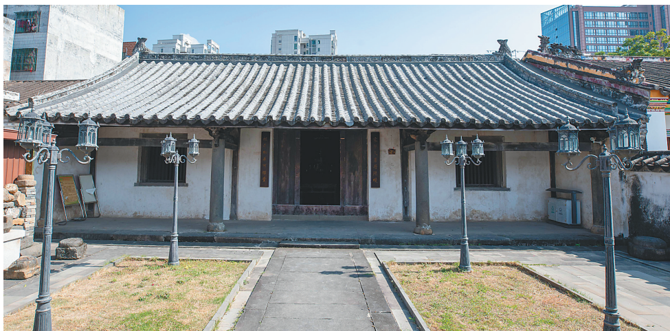
位于海口市琼山区府城街道金花村的丘濬故居。