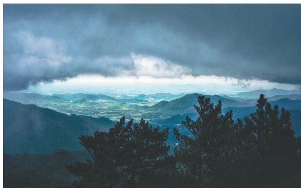
雅加大岭上的「天幕」。

“照片拍摄后,仅仅一分钟左右,我们所站的位置就电闪雷鸣,大雨倾盆。”陈枳衡说,“通过这张照片,可以看到远处50公里外的北部湾海域、近处的海南特有种雅加松。”