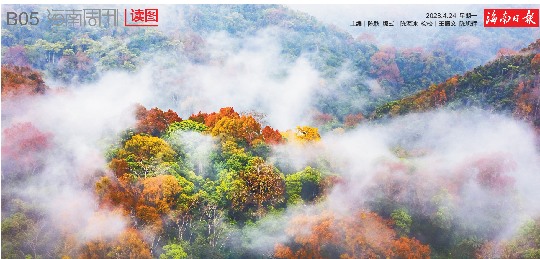
七彩雨林。