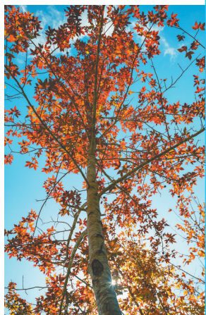
五指山的枫叶红了。