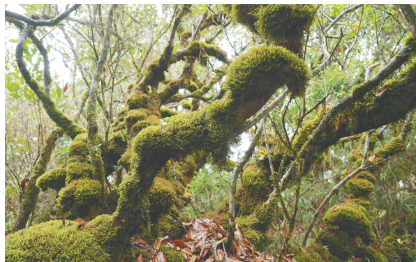
鹦哥岭山顶苔藓矮林。