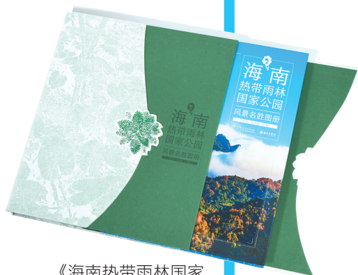
《海南热带雨林国家公园风景名胜图册》的函套设计别出心裁。

说到海南岛热带雨林的风景名胜,人们不由自主地就会想到五指山、鹦哥岭、尖峰岭……它们的形象尤其是主峰的画面,更是经常见诸报端和各类视频作品。然而,在雨林深处和高山之巅,还有很多不为人知、少人涉足的秘境和美景,或赏心悦目,或震撼人心。