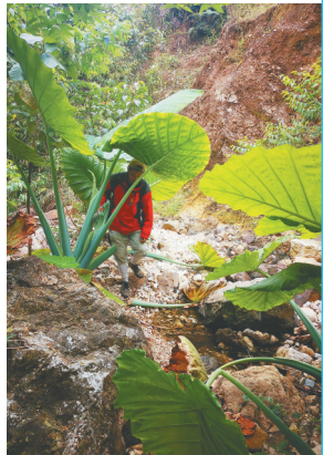
巨叶植物海芋,比身高1米8的人还高。