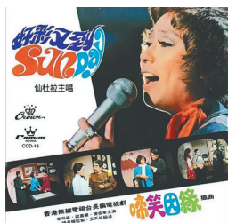
黄霑称《啼笑因缘》为香港流行音乐的分水岭。

这是一场别出心裁的音乐会，登台演出的都是一些年轻人，但他们演唱的曲目却大多是二十世纪八九十年代的金曲，在其中一些歌曲风靡全国的时候，这些年轻人甚至都还没有出生。这是一次跨越时空的演唱会，新时代香港的流行风向标通过歌曲向那个香港流行音乐的黄金时代致敬，在观众的欢呼与掌声中，满满都是对那个香港音乐蓬勃发展年代的怀念，以及对香港音乐未来的憧憬。