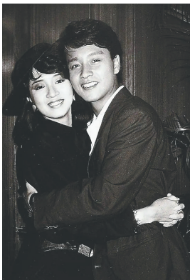
梅艳芳、张国荣是港乐黄金时代的见证者，他们那一代歌手的作品也是无数港乐歌迷心中的青春回忆。