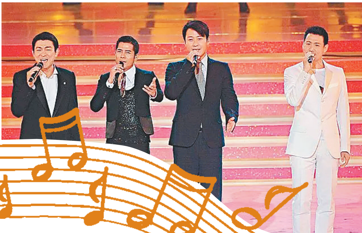
2007年庆祝香港回归十周年文艺晚会活动上，（左起）刘德华、郭富城、黎明、张学友同台合唱。