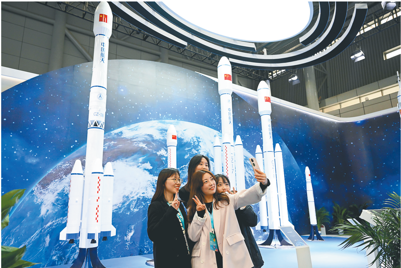
观众在“中国航天日”科普展览上合影留念。