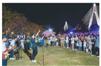
市民在海口世纪大桥下看演出。