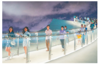
市民游客在天空之山驿站打卡。