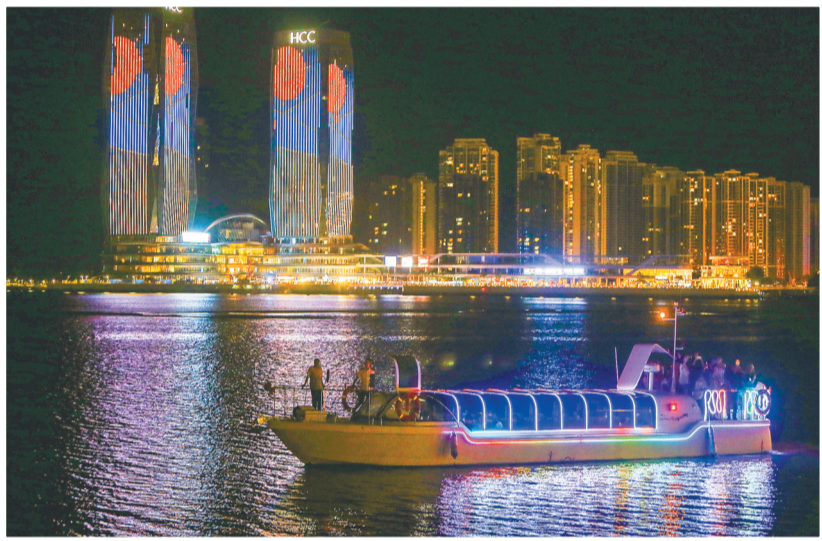
游船在海口湾一带航行。