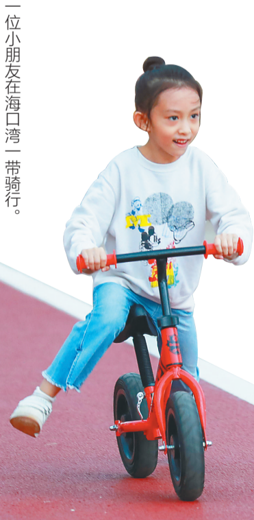
一位小朋友在海口湾一带骑行。