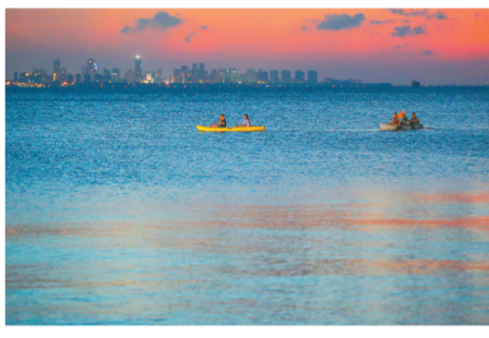
市民在海口西海岸划艇。