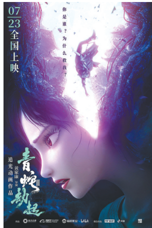
《白蛇2:青蛇劫起》海报。

值得注意的是,在2023年“五一档”上映的十五部新片中就有五部动画电影,包括《新猪猪侠大电影·超级赛车》《宇宙护卫队:风暴力量》《天堂谷大冒险》《魔幻奇缘之宝石公主》《超萌时空宝贝》。这些电影在内容上各有特色,它们与《灌篮高手》等一起构成了“五一档”动画电影的新菜单,也为观众提供了丰富多元的选择。