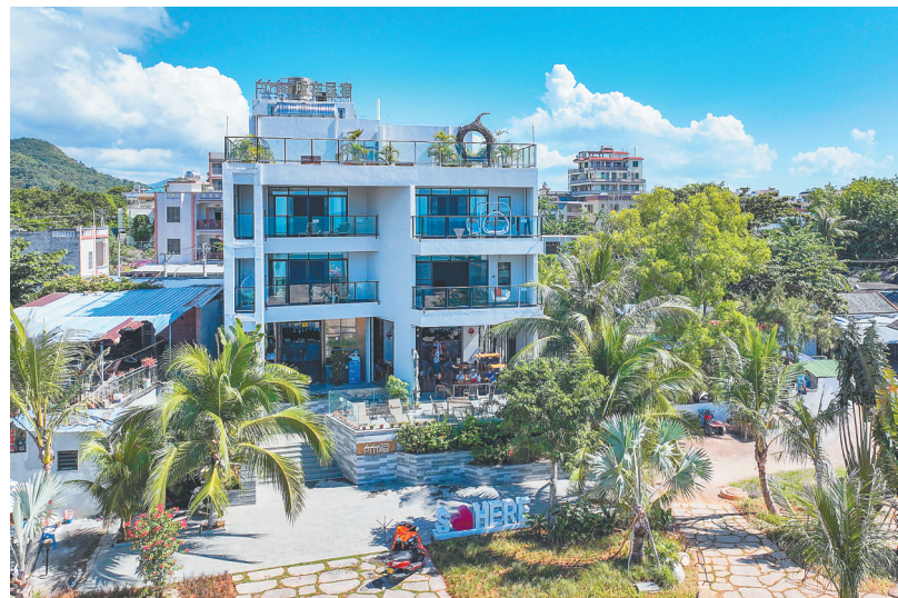
三亚市崖州区梅联社区，美丽小楼随处可见。

长山村莲雾小镇擦亮海南现代农业新奇特优的“金字招牌”，南鹿莲雾等优质水果畅销国内外，今年首次出口加拿大备受追捧，为我省外贸经济增长注入新动能。