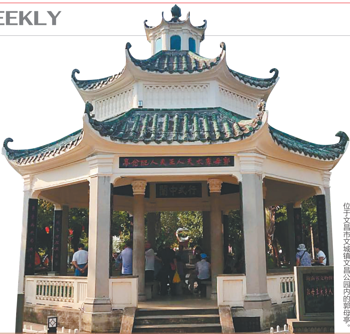
位于文昌市文城镇文昌公园内的郭母亭。