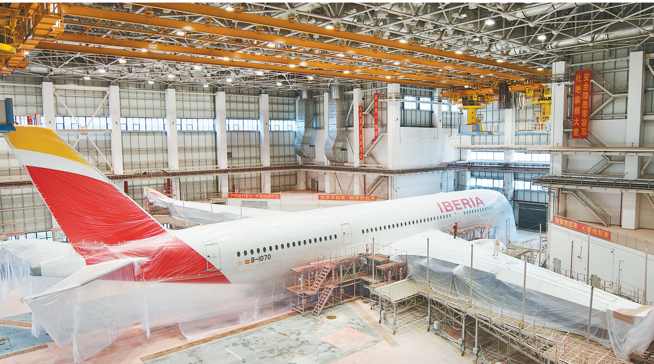
首单A350机型飞机 来琼整机喷涂

部大楼进入二次结构施工阶段…… 看到重大基础设施项目及重点疏解项目规划建设进展顺利，总书记不时点头。 他对现场建设者语重心长地说：“这是百年不遇的历史机遇，你们承担着重要的历史任务，要努力啊！” 座谈会上，紧紧抓住疏解北京非首都功能这个“牛鼻子”，与会人员谈到下一步设想：加快推进首批疏解的项目建设，压茬推进央企、高校、医院第二批疏解项目，同时研究谋划第三批疏解工作方案。 习近平总书记也提出明确要求：“不能凭自身好恶，需要搬就得搬。不能搞‘纸面疏解’‘变相回流’，名义上疏解，结果回去了。更不能通过在京设立二级单位等方式边疏解边新增。” 着眼千年大计，既要不忘初心、一张蓝图绘到底，也要保持耐心、一茬接着一茬干。 考察过程中，面对雄安干部群众，习近平总书记求真务实：“雄安新区建设是千年大计，要久久为功，既不能心浮气躁，也不能等靠要，必须踏实努力、艰苦奋斗。” 座谈会上，面对有关方面负责同志，习近平总书记高瞻远瞩：“雄安新区建设不是一天两天的事，不能当下都吃干榨尽，要留白、留有余地，为远期规划预留项目、地块。要适度超前，但不能过于超前，防止建成项目‘晒太阳’，造成浪费。有的要大举实施，有的要待机而动，有的要与时俱进，既不能急于求成，也不能无所作为。” 下转 A02 版▶