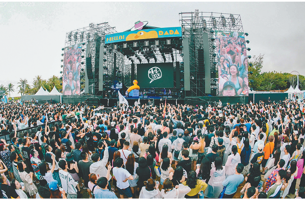
草莓音乐节 三亚“开麦”

营商环境让企业“心动”。 八所港距离项目基地仅1.7公里，可为企业开展全球贸易、配送等提供诸多便利。东方机场建成后，紫金海南公司还考虑将在海南的贵金属配送业务放在东方。 据悉，该项目有望年内完工，达产后年度贸易进出口额约为每年30亿美元，年产值260亿元，可有效带动当地就业及相关产业发展。紫金海南公司正在与有关上下游企业开展洽谈，协同推进建设标准仓、配送仓等，共同做大做强铜精矿仓储配送产业。