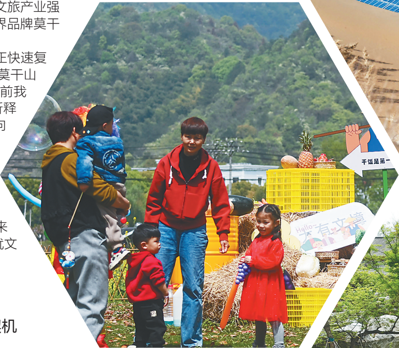
近日,浙江省杭州市富阳区新桐乡推出“春天的盛会”特色乡村文旅品牌。图为汇聚众多农产品及文创产品的“农夫市集”在新桐乡小桐洲村香樟公园内开市。