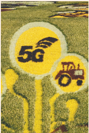
北大荒集团闫家岗农场稻田里“5G”字样的稻田画作(资料照片)。