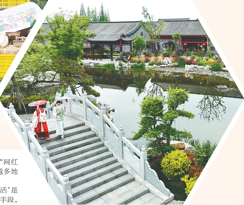
近日,山东省临沂市抓好文旅融合工作,擦亮“红色沂蒙”品牌。