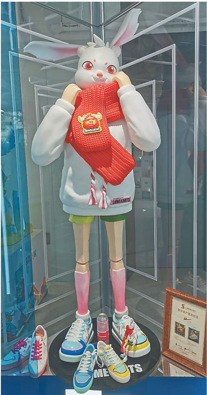
图为回力在上海数据交易所发布的首个数字资产。

随着年轻消费群体的崛起，企业开启跨界共创新姿势，“老字号”纷纷转型为“新网红”。 上海华谊集团旗下的“老字号”品牌回力亮相中国品牌博览会，除了带来消费者熟悉的经典WB-1低帮篮球鞋和565型篮球鞋以外，还带来了众多新款联名鞋。“不服老”的回力更是打造了“数字资产”，实现“老字号”的逆生长。 据介绍，2022年，回力首发数字资产“回力DESIGN元年”，是上海数据交易所数字资产板块成立以来发布的首个数字资产，通过数字资产可兑换购买限量球鞋的权益。受到消费者热捧后，回力又推出了国内首款AR数字资产“哎啊兔”并在上海数据交易所完成登记，通过AR技术进一步提升数字资产的玩乐性和消费者的体验感。 与此同时，百年画材品牌马利不仅演绎了新潮中国色，还主动拥抱时代变化，在保证品牌延续经典、传统的同时，积极迎接年轻和未来。其通过虚拟形象代言人和O版形象以及先进的数字技术，赋予品牌创新、多元、时尚的属性。 为充分释放“老字号”的创新活力，商务部等五部门于今年年初联合印发了《中华老字号示范创建管理办法》。商务部副部长盛秋平说，“‘老字号’在消费促进、产业升级、文化引领、民族自信等方面发挥着重要作用。” （新华社上海5月13日电 记者桑彤 杨有宗 谢希瑶）