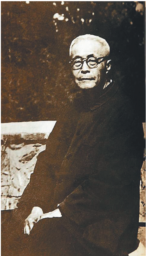
晚年顾颉刚。

以顾颉刚为首的禹贡学人对中国历史地理和边疆地理的研究，并没有因《禹贡》杂志的停刊而停下脚步。从某种意义上讲，它更像是一个新的开端，因为有更多的学人投身其间。