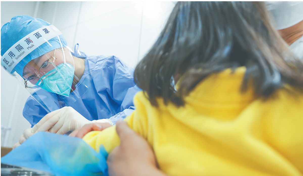
图为一名儿童在北京协和医院急诊科发热门诊看病。

治疗、及时氧疗，对于降低重症风险十分重要。复旦大学附属中山医院感染病科主任胡必杰：根据临床观察，二次感染的人群总体比第一次感染表现的症状要轻，主要表现为发热、喉咙痛。脆弱人群如65岁以上尤其是80岁以上的高龄老人，高血压、冠心病、慢性支气管炎、慢性肝肾疾病、糖尿病等基础病患者，或者患有血液病、淋巴瘤等疾病的人群，容易二次感染，感染后容易重症化。因此，这类人群一旦出现发热，尤其是家庭成员或周边人群已经明确新冠感染，要及时做核酸或抗原检测，早发现、早治疗，尽早使用抗病毒药物。