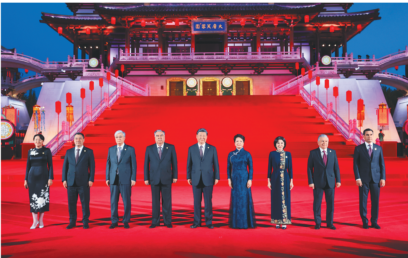
5月18日晚，国家主席习近平和夫人彭丽媛在陕西省西安市大唐芙蓉园为出席中国－中亚峰会的中亚国家元首夫妇举行欢迎仪式和欢迎宴会。宴会后，习近平夫妇同贵宾们共同观看中国同中亚国家人民文化艺术年暨中国－中亚青年艺术节开幕式演出。这是习近平夫妇在紫云楼前同贵宾合影留念。

了古都西安人民的热情好客，体现了中华文化兼容并蓄的精神风貌。 习近平和彭丽媛同贵宾们共同前往元功门举行欢迎宴会。 习近平发表欢迎致辞，代表中国政府和中国人民热烈欢迎中亚各国元首。 习近平指出，陕西是古丝绸之路的东方起点，见证了中国同中亚国家两千多年的深厚友谊。千百年来，中国同中亚人民互通有无、互学互鉴，创