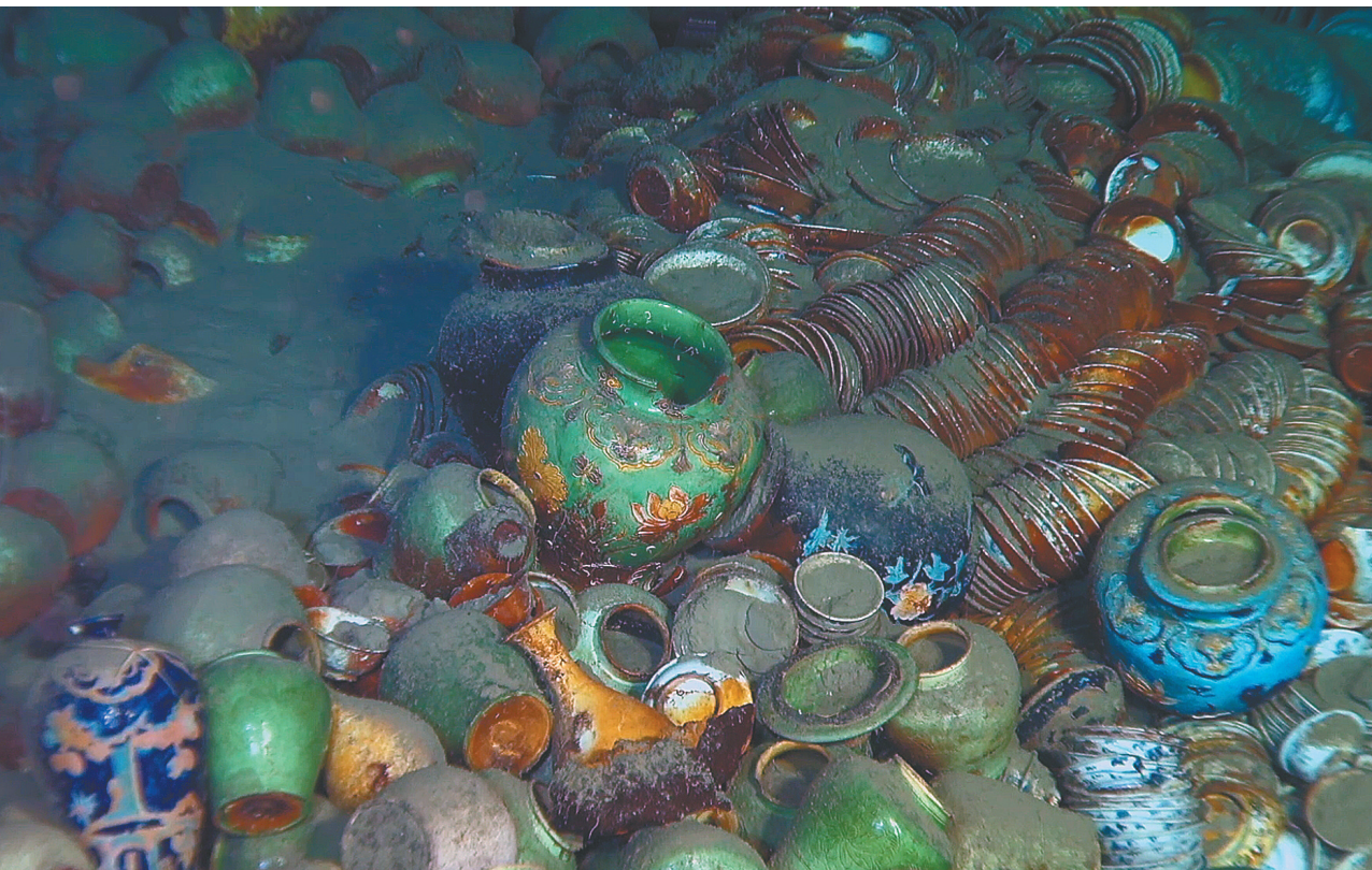
这是南海西北陆坡一号沉船内部(2022年10月摄)。