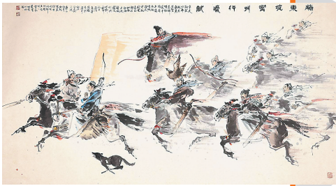
《密州出猎图》。本版图片均为资料图