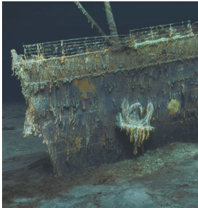
泰坦尼克号3D扫描图。本版图片均为资料图

“泰坦尼克号”是英国白星航运公司的一艘奥林匹克级邮轮，是当时世界上体积最庞大、内部设施最豪华的客运轮船。1911年5月31日下水，1912年4月2日完成试航。1912年4月14日23时许，行经大西洋的泰坦尼克号遭遇厄运，与一座冰山相撞，最终船体断成两截沉入海底。船上2224名船员及乘客中，逾1500人丧生，仅333具遇难者遗体被找回。