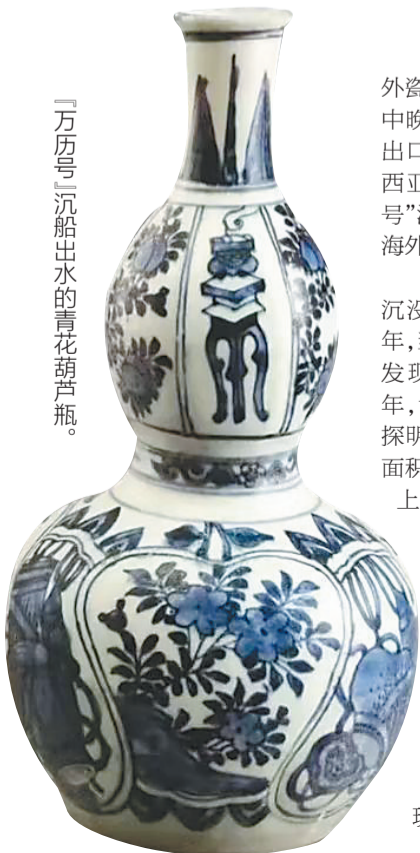
『万历号』沉船出水的青花葫芦瓶。

明代中晚期，受传统观念和中外文化交流的影响，外销瓷器的装饰多以佛教、道教、伊斯兰教及中国传统吉祥题材相关内容为主。瓷器表面的图案和文字饱含人们对现实生活的美好憧憬。“万历号”出水的瓷器，见证了中国瓷器外销的辉煌历史。