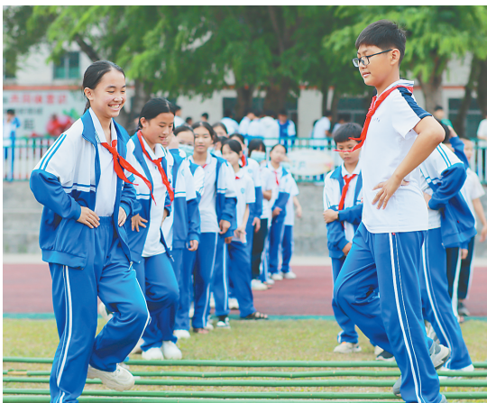
澄迈县昆仑学校以竹竿舞作为全校大课间操。