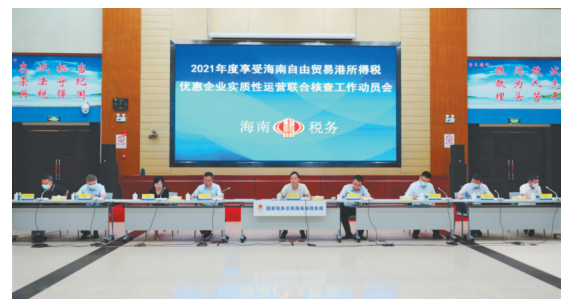
去年10月，海南省税务局与省发改委、省财政厅等六部门召开2021年度享受海南自由贸易港所得税优惠企业实质性运营联合核查工作动员会。