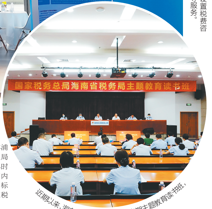
近两年来，海南省税务局连续举办多期主题教育读书班，推动理论学习走深走实。