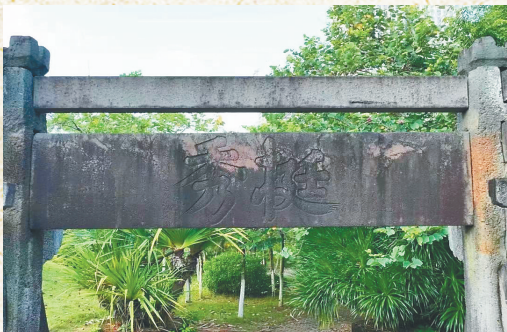
海南年代最古老牌坊之一挺秀牌坊上的“挺秀”二字为凹字楷书。

海口市区内石雕牌坊的形制从古至今，不断变化着、发展着。它们见证了文化的繁荣，也见证了城市的变迁与发展。书法文化与牌坊融合，展现了独特的文化气质和别样风姿，它们交相辉映于天涯，为海南增添了厚重的文化底蘊。