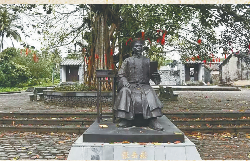
高林村内的张岳崧雕像。

“西天庙”三字是张岳崧的行书榜书作品，气势宏伟，沉稳厚重中不乏灵动，蓄劲健之气，奇笔妙绝，功力不凡，深得颜鲁公大字之妙，又蕴二王之笔意。“西”字笔画粗重有力，“飞白”笔法运用恰到好处，线条变化丰富，极具美感，使原本笔画简单的字，变得浑厚又灵动。“天”字道美清劲，逸趣蔼然，笔蓄二王之意。“庙”字笔墨饱满，笔画虽肥而筋骨内含，不郁不滞，与“西”字呼应，浑然天成。三字整体帖味浓郁，与时人好碑味的书风形成反差，极具鲜明的个人书法面目。细细品味，此三字榜书作品与他所留存的多幅行书作品风格极为一致，均以二王、颜体为底，参以米芾的用笔之态，生动变化，厚重中富有劲健灵动之气。整个牌匾雕工精湛，飞白笔画雕得丝丝生动，笔意交代清晰、饱满，是难得一见的珍品。