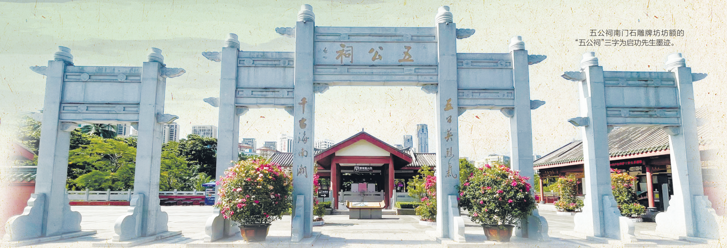
五公祠南门石雕牌坊坊额的“五公祠”三字为启功先生墨迹。